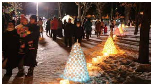
アイスクャンドルが並べられ幻想的な『めむろ氷灯夜』