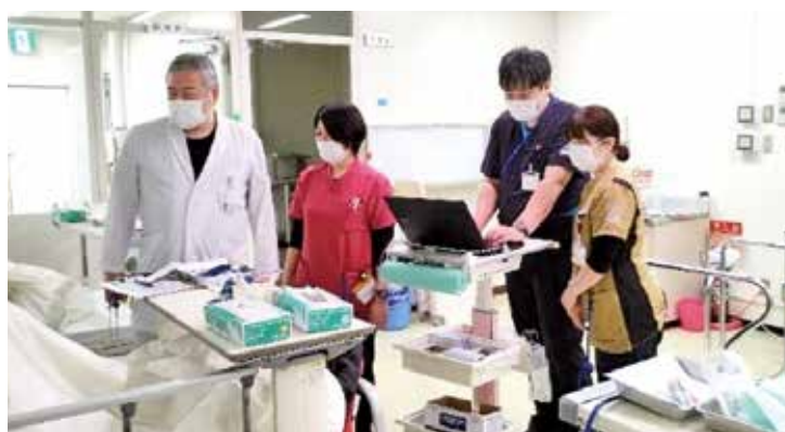
透析スタッフの回診

時間は21時30分となっております。なお、患者さんの受け入れ人数は3〜4名程度です。食事の提供はありませんのでご了承下さい。