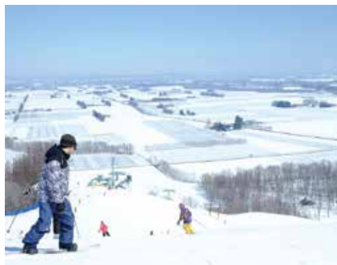
新嵐山スキー場からは十勝平野を一望できる

降雪量は道内では多い方ではなく、2～3月に一時的に多量の降雪(通称：春のドカ雪)となることがあり、一度に50～60cmが降雪することもあります。