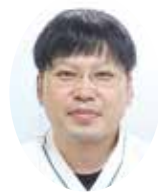
リハビリテーション科 主任理学療法士 (運動器認定理学療法士)