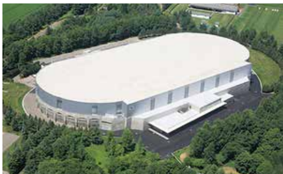
明治北海道十勝オーバル・アリーナ(帯広市)は芽室町に隣接