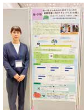
松崎主任調理師も参加！

ポスターセッションに参加した職員も各専門分野から研究の成果や日々の業務で得た知見などを発表し更なる地域医療の発展に向けた取り組みを発表しました。