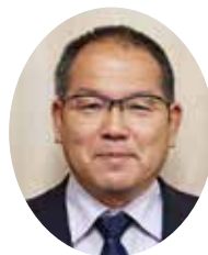
管理者 おおや みつひろ 大屋 光宏 (邑南町長)