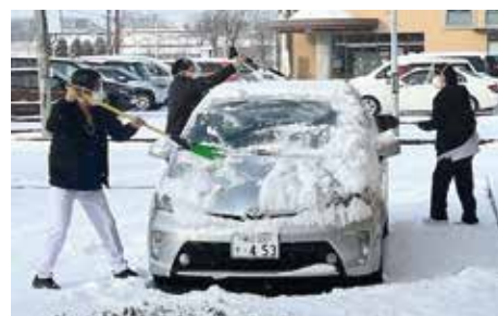
降雪のなか訪問診療に向かう公立芽室病院の 総合診療科医師と看護師

冬は基幹産業の畑作農業が完全に農閑期に入りますが、農産物の加工工場はフル稼働します。厳寒期に畑が凍ってしまうと春先の農業に影響が生じるため、一定の降雪が必要であり、大切な天の恵みとなります。