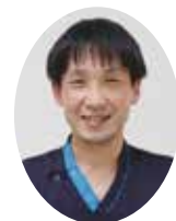
臨床工学科 主任臨床工学技士