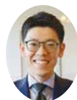
事務部医事経営課 主任