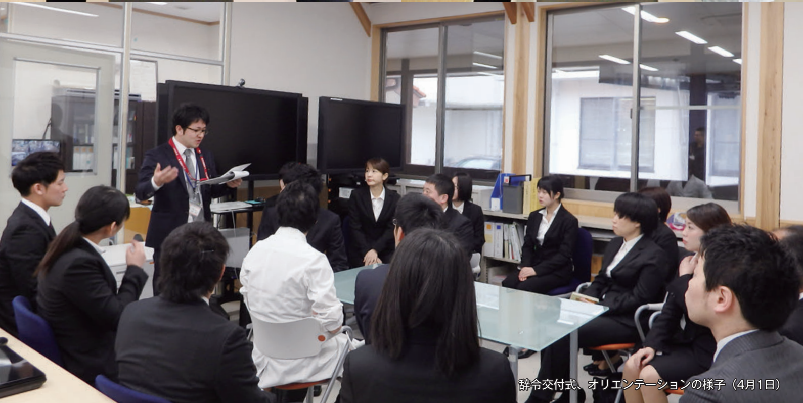
辞令交付式、オリエンテーションの様子（4月1日）