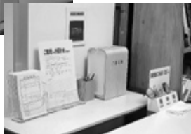
ご意見箱設置場所