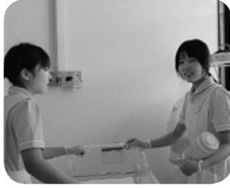
アルバイトの様子