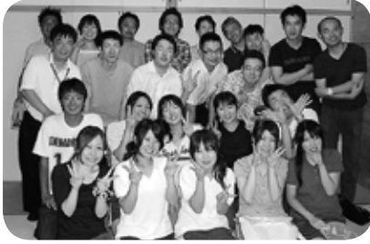
職員との懇親会での様子

平成20年8月1日～8月22日までの期間、邑智病院初の試みで看護学生を対象とした夏期アルバイトを実施しました。夏休みの期間を利用し、看護体験とあわせて主に病棟での環境整備、患者さんの身の回りのお世話、メッセンジャー業務などの仕事をしてもらいました。