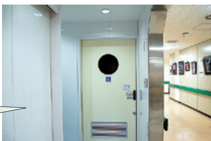
1F 外来身障者用トイレ