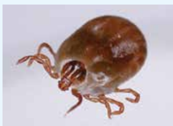
フタトゲチマダニ

ダニ媒介感染症とは、病原体を保有するダニに咬まれることによって起こる感染症のことです。野外作業