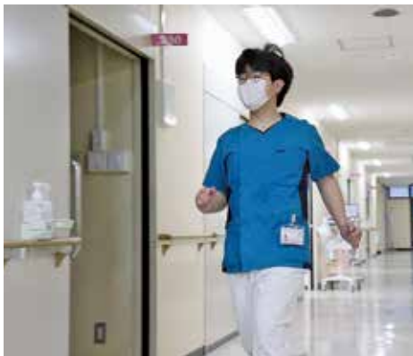
ナースコールを受け病室へ

急性期病棟は入退院が多く慌ただしいところですが、いつもと違つちよつとしたことに気づくという看護の力を発揮し、ご家族とともに喜びを感じた瞬間でした。