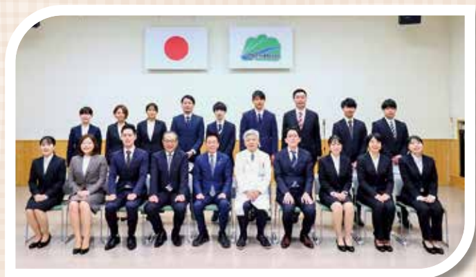
R4.4.1 辞令交付式において

新しい環境で様々なことを学びたいと思います。至らない点があると思いますが、ご指導の方よろしくお願いいたします。