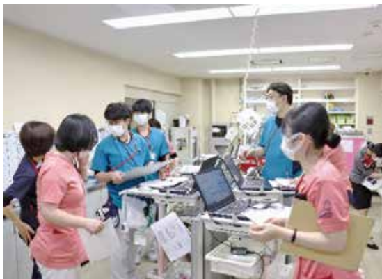
患者さんの状態をスタッフ同士で共有します

さらに驚いたことに、口の中をケアしているとき口をもぐもぐさせておられるではありませんか。すかさず、主治医へ報告し、何か食べていた