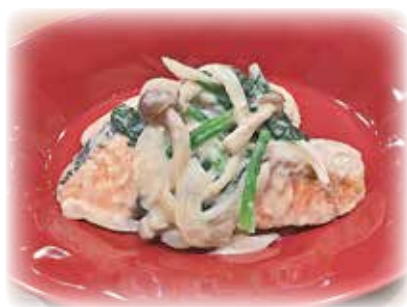
鮭の味噌クリーム煮